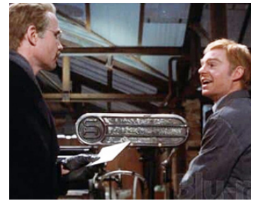
1974 LE DOSSIER ODESSA (The Odessa File) de Ronald Neame avec Jon Voight