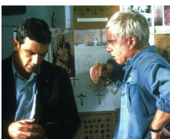
2001 LE TOMBEAU (The Body) de Jonas McCord avec Antonio Banderas