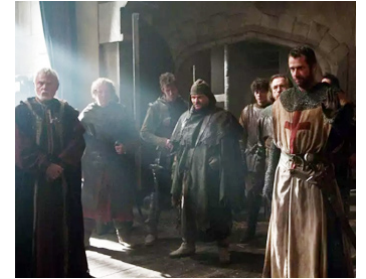
2011 LE SANG DES TEMPLIERS (Ironclad) de Jonathan English avec Jason Flemyng