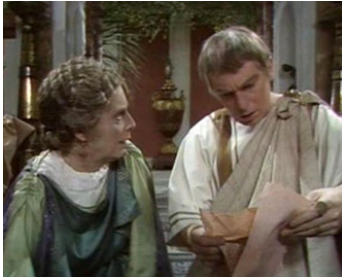
1976 MOI, CLAUDE EMPEREUR (I Claudius) d'Herbert Wise avec Fiona Walker