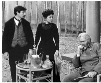
1970 LES TROIS SŒURS (Three Sisters) de L. Olivier avec Joan Plowright, Laurence Olivier