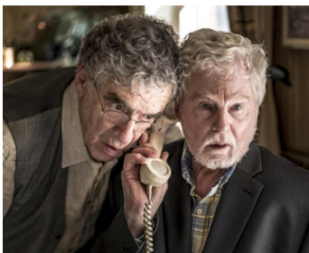
2016 L'HISTOIRE DE L'AMOUR (The History of Love) de Radu Mihaileanu avec Elliott Gould