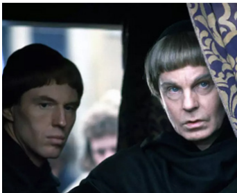
1982 LE BOSSU DE NOTRE DAME (The Hunchback of Notre Dame) de M. Tuchner avec Tim Pigott Smith