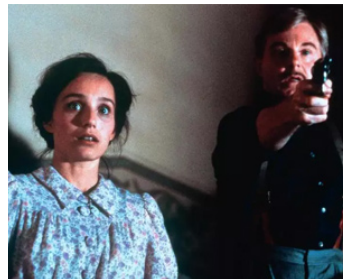
1988 LE DIXIÈME HOMME (The Tenth Man) de Jack Gold avec Kristin Scott-Thomas