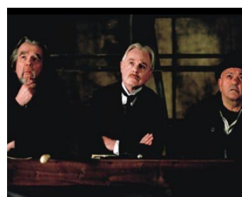
2005 BYE BYE BLACKBIRD de Robinson Savary avec Michael Lonsdale