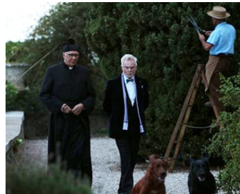
2014 GRACE DE MONACO (Grace of Monaco) d'Olivier Dahan avec Frank Langella