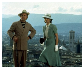
2000 IL SUFFIT D'UNE NUIT (Up at the Villa) de Philip Haas avec Kristin Scott-Thomas