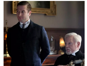
2012 TITANIC DE SANG ET D'ACIER (Titanic, Blood and Steel) de Ciaran Donnelly avec Billy Carter