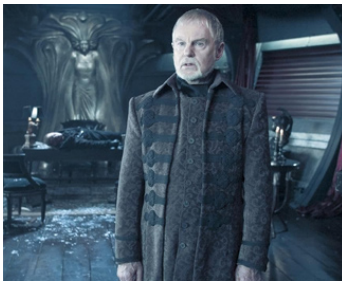
2006 UNDERWORLD 2, ÉVOLUTION (Underworld: Evolution) de Len Wiseman