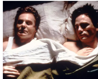
1998 LOVE IS THE DEVIL (Love is the Devil) de John Maybury avec Daniel Craig