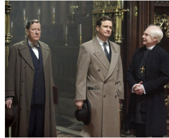
2010 LE DISCOURS D'UN ROI (The King's Speech) de Tom Hooper avec Geoffrey Rush, Colin Firth