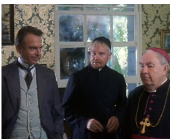
1999 DAMIEN DE MOLOKAI (The Story of Father Damien) de Paul Cox avec S. Neill, L. McKern