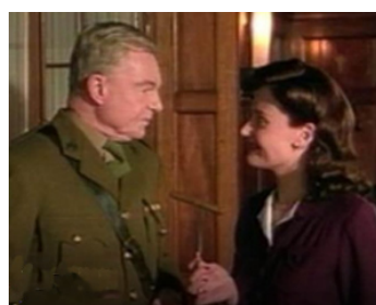
2002 TWO MEN WENT TO WAR de John Henderson avec Rosanna Lavelle