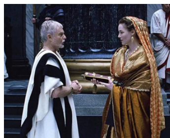
2000 GLADIATOR (Gladiator) de Ridley Scott avec Connie Stevens