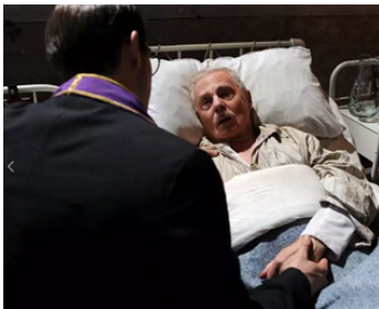
2011 AU PRIX DU SANG (There Be Dragons) de Roland Joffé avec Charlie Cox