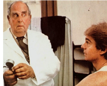
1979 LA GUERRE DES OTAGES (The Human Factor) d'Otto Preminger avec Robert Morley