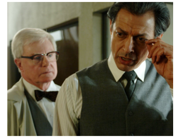
2008 ADAM RESURRECTED de Paul Schrader avec Jeff Goldblum