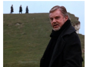
1989 HENRY V (Henry V) de Kenneth Branagh