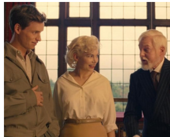
2011 MY WEEK WITH MARILYN de Simon Curtis avec Eddie Redmayne, Michelle Williams