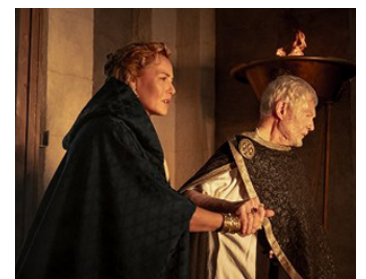
2024 GLADIATOR 2 (Gladiator II) de Ridley Scott avec Connie Nielsen