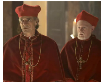
2011 LES BORGIA (The Borgias) de Neil Jordan avec Jeremy Irons