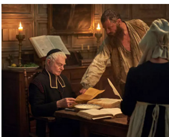
2019 LES MISÉRABLES de Tom Shankland avec Dominic West