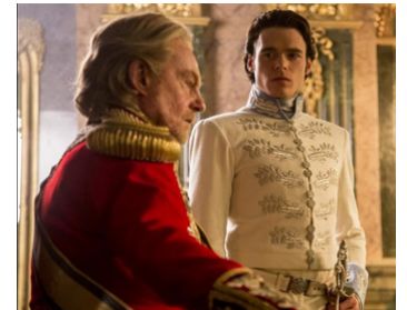
2015 CENDRILLON (Cinderella) de Kenneth Branagh avec Richard Madden