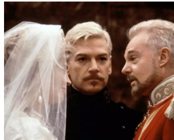
1996 HAMLET (Hamlet) de Kenneth Branagh avec Julie Christie, Kenneth Branagh