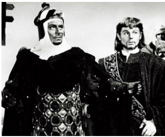
1965 OTHELLO (Othello) de Stuart Burge avec Laurence Olivier