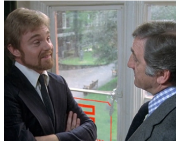
1978 LA GRANDE MENACE (The Medusa Touch) de Jack Gold avec Lino Ventura