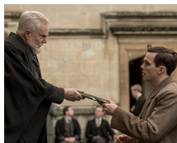
2019 TOLKIEN (Tolkien) de Dome Karukoski avec Nicholas Hoult