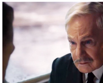
2017 LE CRIME DE L'ORIENT-EXPRESS (Murder of the Orient-Express) de Kenneth Branagh