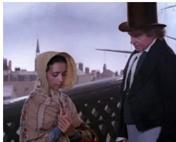
1987 LA PETITE DORRITT (Little Dorrit) de Christine Edzard avec Sarah Pickering