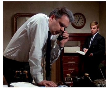
1972 CHACAL (The Day of the Jackal) de Fred Zinnemann avec Michael Lonsdale