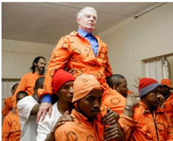
2012 JAIL CAESAR (Jail Caesar) de Paul Schoolman