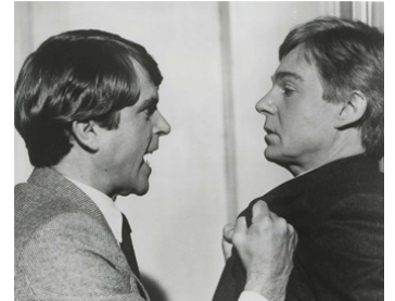
1982 ENIGMA (Enigma) de Jeannot Szwarc avec Sam Neill